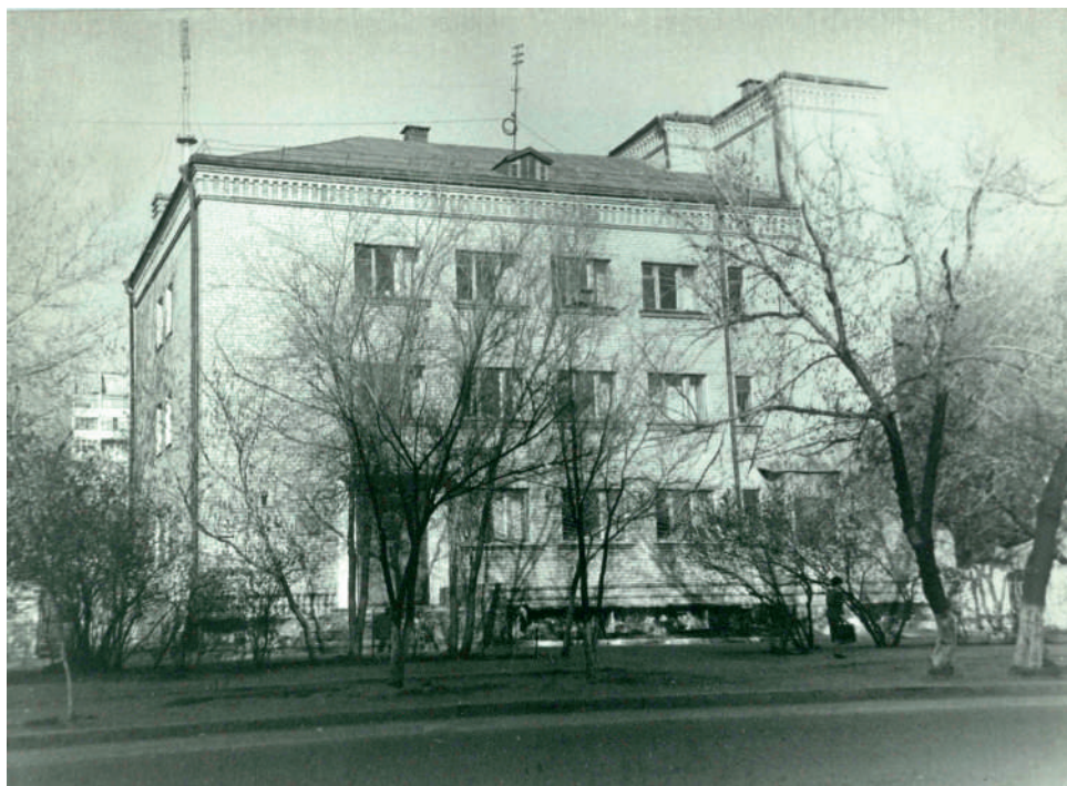
Партийный архив Оренбургского обкома КПСС на улице Выставочной (ныне — Маршала Г.К. Жукова), д. 38. 1968 г.