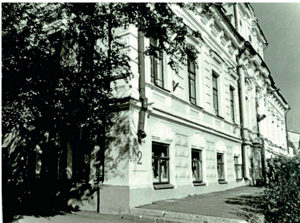
Здание Оренбургского городского дворца творчества детей и молодежи (переулок Хлебный, д. 2), в одном из помещений которого в 1947–1966 гг. располагался партийный архив Оренбургского обкома КПСС